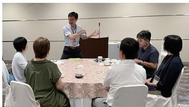
参加者の質問に答える大学教職員

神奈川大学後援会は、大学の最新情報や学修・学生生活・就職・健康管理などの修学上の重要なポイントやサポート体制等について理解を深めてもらうため、毎年6月～9月に各キャンパス及び地方会場で保護者説明・懇談会を開催しています。保護者同士や大学関係者、後援会役員との交流を深める場となっており、ご参加いただいた皆さまからは、「大学のことがよく理解できた。」と大変好評をいただいています。皆さま、ぜひご参加ください。