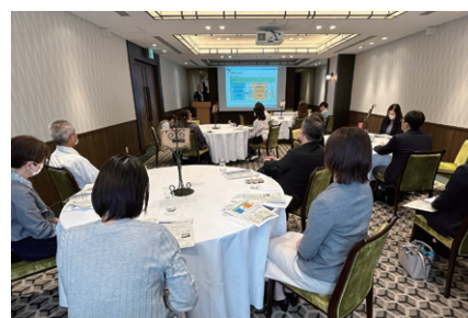
保護者説明・懇談会（松山会場）の様子