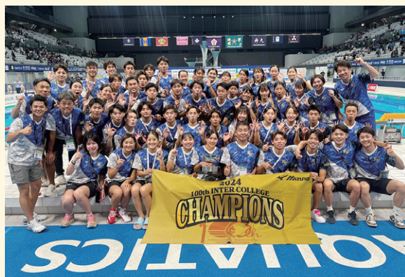
チャンピオンフラッグを掲げ喜びの部員たち

日本学生選手権水泳競技大会（インカレ）が9月5日から8日、東京アクアティクスセンターで開かれ、本学水泳部女子チームが3年ぶり3度目の総合優勝を果たしました。本大会は、個人の活躍がチームの得