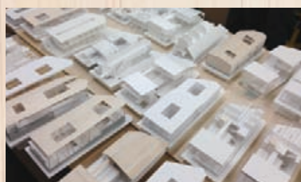
検討中の模型たち。こうした模型をたくさん作って比較検討して詰めていきます。

29号館(国際センター)は「日本らしさ」をテーマにした建築です。日本の寺社仏閣に用いられている伝統的な木造建築技術をさらに発展させた、現代の法律と防火規制に適合する新しい構造躯体を採用しています。都市部に大型の木造建築を実現させたこと、構造、防火面における先進的な取り組みが評価され、国土交通省・平成26年度木造技術先導事業に採択されました。また、計画・設計には本学工学部建築学科の教員と大学院生が参画してプランニングとスタディを重ね、卒業生が設計と監理に携わって完成しました。環境面でもカーボンオフセットを実現した事例として注目されています。