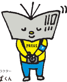
オリジナルキャラクター パンぱくん