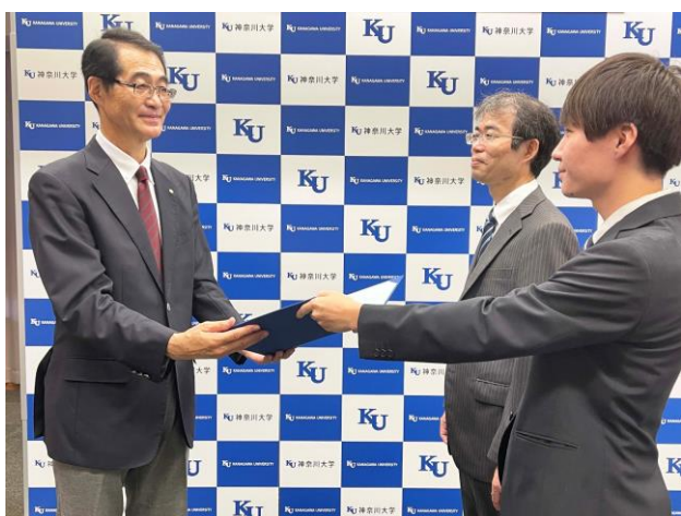
称号記授与の様子