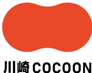
川崎大師の赤をイメージしたロゴ

3者は，連携して川崎市京急沿線エリアでのエリアマネジメント活動に取り組むと同時に，今後，京急川崎駅周辺エリア，京急大師線沿線エリアなどに活動の拡大を予定しています。