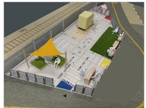
「Park Line 870」イメージ