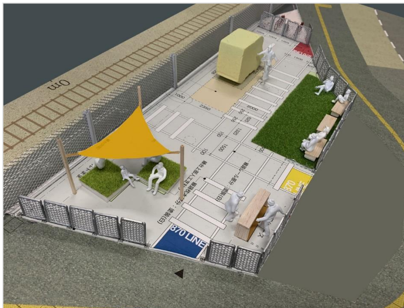
「Park Line 870」イメージ