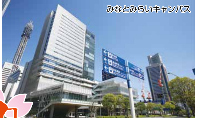
みなとみらいキャンパス