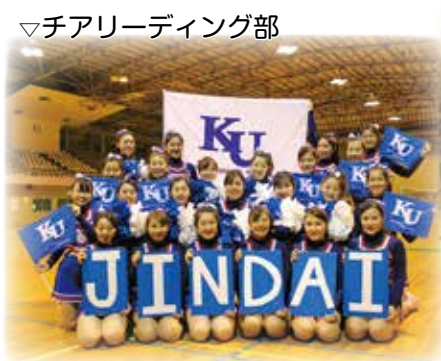
▽チアリーディング部