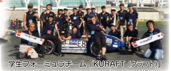
学生フォーミュラチーム「KURAFT (クラフト)」