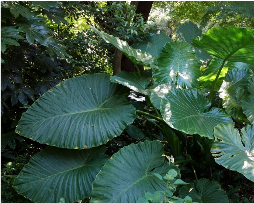
図1：木漏れ日が当たっているクワズイモ。東京大学構内の圃場において撮影