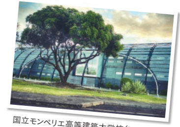
国立モンペリエ高等建築大学校(フランス)