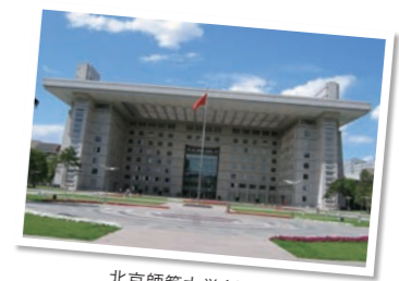
北京師範大学(中国)

※掲載内容は派遣交換留学または推薦語学研修対象校。2022年度以降の派遣先については当該年度の募集要項にて確認してください。 ※凡例はP13を、プログラム種別の詳細はP10を参照してください。