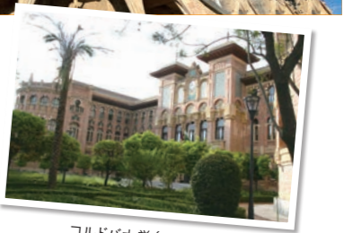
コルドバ大学(スペイン)

※掲載内容は派遣交換留学または推薦語学研修対象校。2022年度以降の派遣先については当該年度の募集要項にて確認してください。 ※凡例はP13を、プログラム種別の詳細はP10を参照してください。