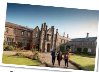
ヨーク・セント・ジョン大学(イギリス)

※掲載内容は派遣交換留学または推薦語学研究対象校。2022年度以降の派遣先については当該年度の募集要項にて確認してください。