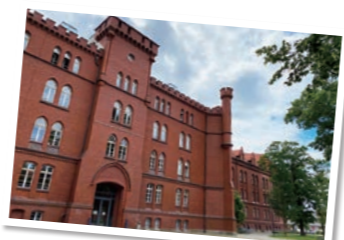
ブランデンブルク応用科学大学(ドイツ)