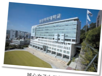
誠心女子大学(韓国)

※掲載内容は派遣交換留学または推薦語学研修対象校。2022年度以降の派遣先については当該年度の募集要項にて確認してください。 ※凡例はP13を、プログラム種別の詳細はP10を参照してください。