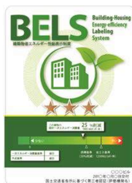
〔図1〕 ガイドラインに基づく第三者認証の例

また、ダイヤモンドリスponsに対応した時間帯別・季節別の電気料金メニューが選択できる場合はその活用に努めるとともに、エネルギー管理システム（BEMS・HEMS等）の導入により、ビルの運用方法、住宅の住まい方の改善によるピーク対策及び省エネルギーに努めること。