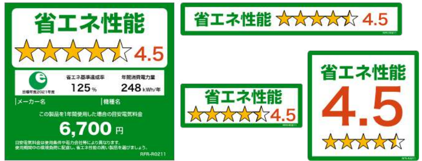
(冷蔵庫のイメージ※)

※冷蔵庫、冷凍庫、照明器具及び電気便座については、 11月中に上記様式に変更予定