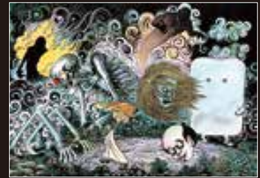
横浜初公開 『妖怪と図像 その姿かたち』