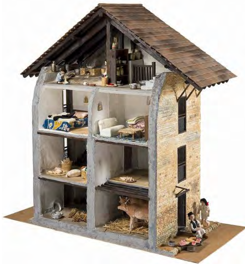
写真 1: ネパールの伝統的な台所(1/10 模型) W1125xD525xH1030 ネパールのカトマンズ地方に暮らすネパール人の伝統的な住まいの台所は、家の最上階にある。 台所はヒンズー教徒にとって神聖な場所のため、家族以外の人は立ち入ることができない。 所蔵: 宮崎玲子