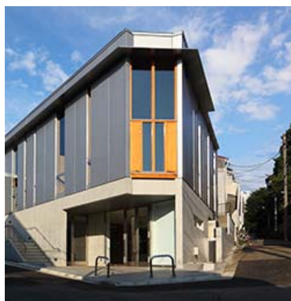
ごうかん がいかん 29号館 外観