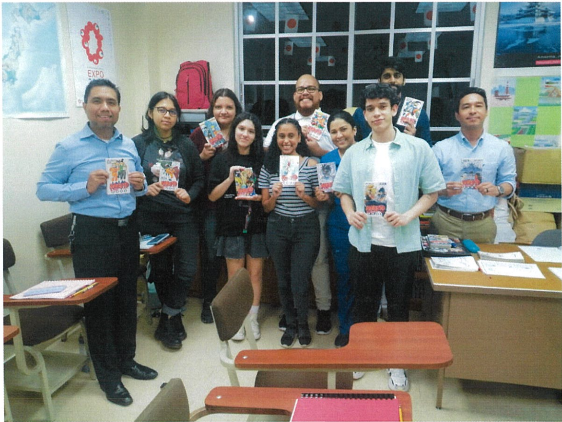
日本語クラスの生徒たち