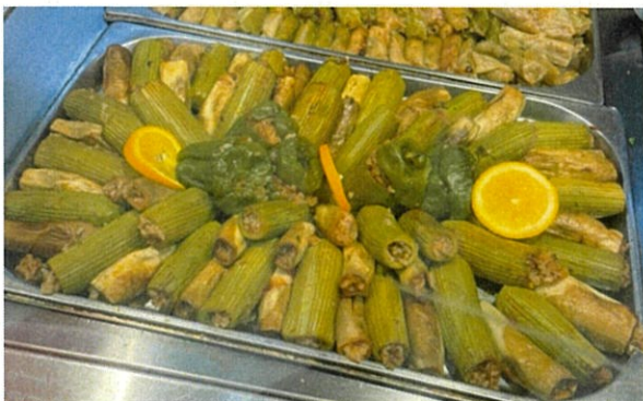
野菜にご飯を詰めた「マフシー」。