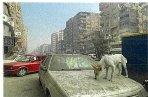
エジプトの街並み。