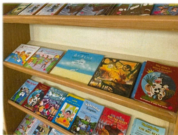
本は図書室に置きました。