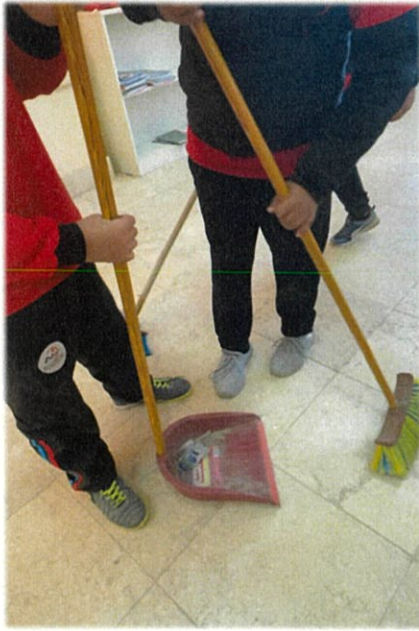
子どもたちが掃除をしている様子。

日本では子どもたちが自分たちで掃除をするのは、ごく普通の光景かもしれません。海外では子どもたちではなく、清掃会社が学校を掃除するそうです。しかし、EJSでは掃除の時間を導入し子どもたちの美化意識や協調性を育もうとしています。実際にエジプトの街ではゴミが道端にたくさん捨てられています。このような教育がエジプトの未来を変えていくと私は期待しています。