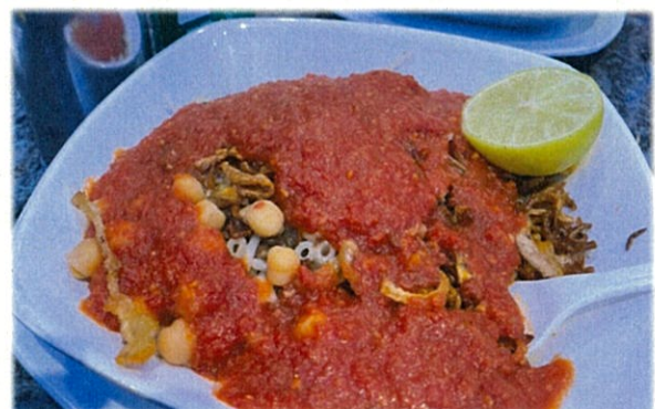
国民的メニュー「コシャリ」。