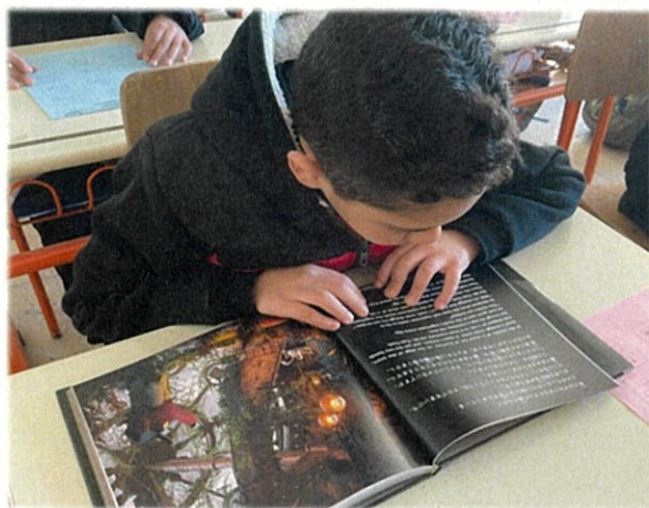
子どもたちが読んでいるところ。