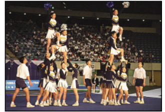
昨年度の大会の様子

●第22回全日本学生 チアリーディング選手権大会 12月11日(土)~12日(日) 国立代々木競技場第一体育館