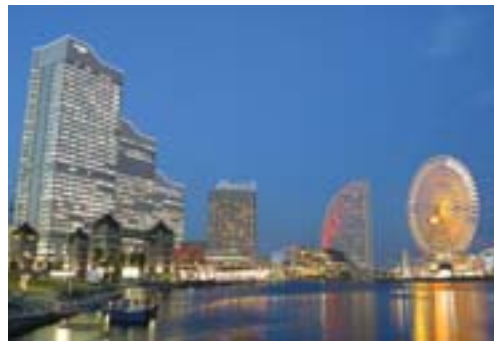
左端がKUポートスクエアのあるクイーンズタワーA