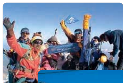
▲登山基地のガラバシ小屋で記念撮影(後ろエルブルース峰)