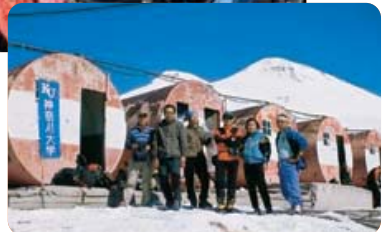
▶エルブルース頂上で応援歌を大合唱

き八丁を二ピッチで稜線に飛出し、緩やかな尾根を辿って午前十時、念願のエルブルース山頂に到達、全員で神大応援歌を大合唱しました。