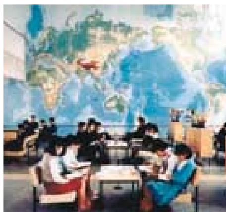
「竣工間もないマップホール」1966(昭和41)年