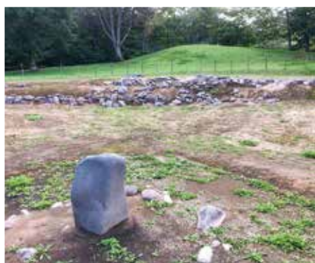
小牧の遺跡の環状列石 中央の石を中心に直径55mの円状に独特な配列で石が並ぶ

「北海道・北東北の縄文遺跡群」が世界文化遺産候補となり、今年9月には国際記念物遺跡会議（イコモス）が現地調査をしました。調査結果を踏まえて来年の春にはユネスコへの答申があり、夏には世界遺産委員会が世界文化遺産登録を決定する予定となっています。