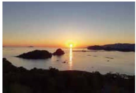
宿毛湾から夕陽を眺める(令和2年10月20日撮影)