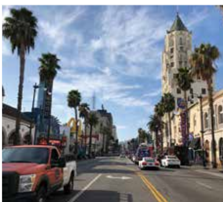
ロスアンゼルス街の街並み

先だって、少年野球チームが再開しました。カリフォルニア州では、未だ試合の開催が認められていないため、隣州に遠征する機会が増えてきました。小学生の野球の試合に、月に2回、片道5時間掛けて移動するのは、狂気の沙汰ではありますが、いやはや、これも、いずれ楽しい思い出となると信じております。渡米19年、苦境の中、まだまだ頑張ります！