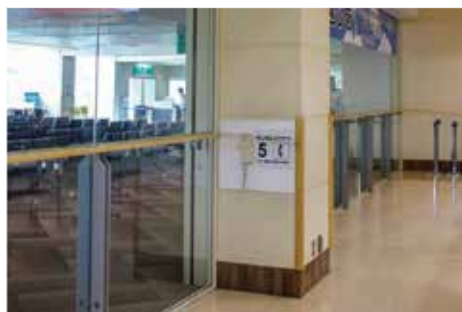
保安検査場を通過した搭乗客側と、見送り客側との間が全面ガラス張り、ガラス面の途中にある柱3か所に2回線ずつ6回線が設置されており、映画は5番で撮影された。

ても、スマートフォンのテレビ電話機能で顔を見ながらいつでも会話が出来る時代で、設備としては時代遅れの感がしますが、そのアナログの感じが若い方に受け入れられ、「ロケ地巡礼」場所として人気になっていくようです。