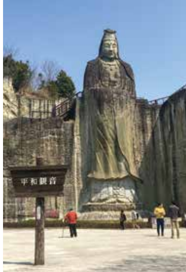
宇都宮市大谷地区の「大谷観音」

現在、JR宇都宮駅東口の再開発が本格的に始まり、まさに県都宇都宮の顔として相応しい姿に変貌しつつあります。コンベンションホールをはじめ、多くの魅力ある施設や