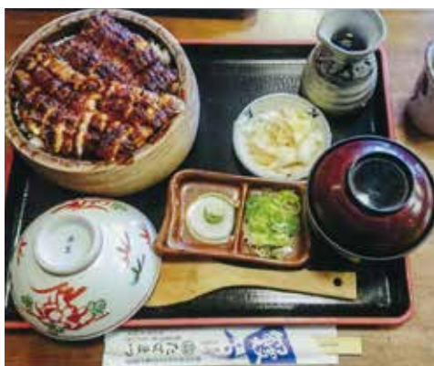
名物 鰻ひつまぶし

屋城本丸御殿の復元(完了)、レゴランド、セントラルパークのリメイクなど「観光名古屋」を目指しています。