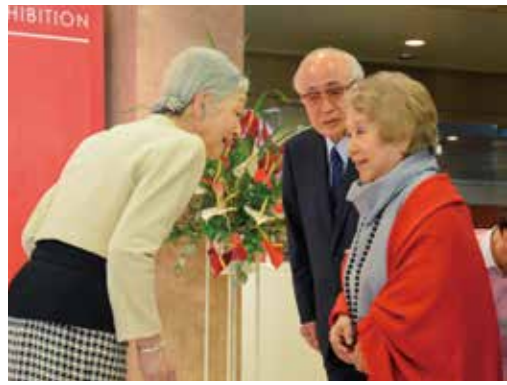
「ねむの木の子どもたちとまり子美術展」におでましの現上皇后陛下を宮城まり子さんとお迎え (松岡ゼミ13期生渡部尚人君撮影)

救いの手を差し伸べてくれたのは、36年に及ぶパソコン歴と、スマホのiPhoneでした。音声入力や読み上げ機能の活用に加えて、スマホにAudibleやAudible Kindle版の書籍をダウンロードすれば難なく購読ができます。スマホは、携