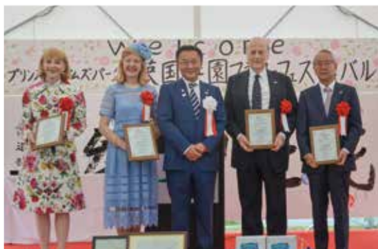
2019年6月福島県本宮市にある英国庭園にて交流親善大使任命式（右端が筆者）

2012（平成24）年、福島民報新聞とケンジントン&チェルシー王立区の支援を受け、英国民が福島を支援するシンボルとして「福島庭園」をロンドン市内に造設しました。また一昨年には福島県本宮市に英国庭