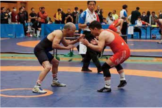
全日本マスターズレスリング選手権大会で(左が筆者)

1993(平成5)年に東四国国体が香川県、徳島県で開催されることとなり、未普及競技であるレスリング競技をどうすれば?という難題が持ち上がりました。そこでレスリングを経験した人たちが少年レスリングクラブを立ち上げることとなり、私も町内に少年レスリングクラブを設立しました。