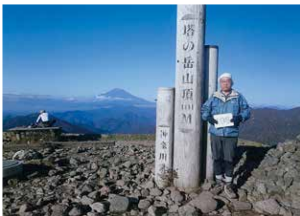
塔の岳山頂で(2016年10月77歳)

計画通りの山登りには、次の体調管理が大事だ。▽日常の歩行管理 一日8,000歩を目標とし、アルコールの飲みすぎなどに気をつけ計画通りの登山に挑んでいた。(ちなみにタバコは吸わず)▽リタイア後の歩行(歩行記録による) 60歳〜79歳(20年間)で65,295,800歩、1日平均8,900歩。歩いた距離(1歩0.5 メートル で計算)は約32,648 キロメートル で、地球を約0.82周回したことになる▽リタイア後のアルコール飲料(飲料代記録による、飲量は金