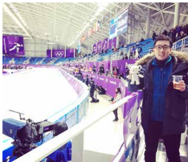
2018年平昌五輪で筆者

インカレ総合部門の優勝常連校に名を連ねています。また、学生たちの活躍は社会人選手が凌ぎを削る全日本クラスの大大会、国内だけでなく世界ジュニア・ユニバーシアード・ワールドカップ・世界選手権と言った海外の試合にも及んでいます。直近では2018年、韓国で開催された平昌五輪にOG1人、学生1人の選手が出場権を掴み取り、スケート部スピード部門の歴史に新たな1ページを刻みました。 歴史は浅い部ではありません