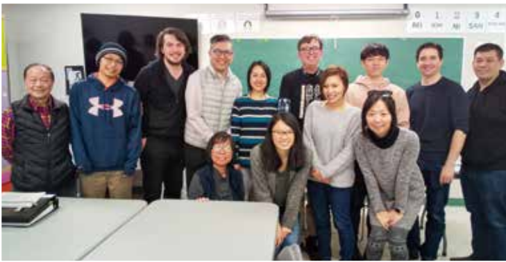
参加したバンクーバー研修会(後列中央が筆者)

私は2008年理学部化学科に入学しましたが、バイオや遺伝子に関する学問に興味を持ち、2年次に生物科学科へ転科をしました。平塚キャンパスでの4年間は、勉強中心の毎日でしたが、沢山の友人との交流や国内外の旅行、短期留学など充実した学生生活でした。卒業後は東日本旅客鉄道に就職し、現在は営業主任として八戸駅で仕事をしています。