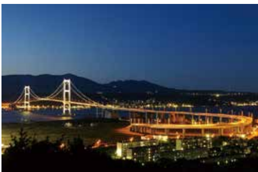
室蘭市の観光スポット 白鳥大橋と工場夜景 日本夜景遺産に選定 (H25)

定された地球岬(同)、「ウポポイ」(アイヌ文化復興拠点・民族共生象徴空間、白老町)、世界遺産登録を目指す隣町・伊達市の縄文遺跡、登別温泉や洞爺湖温泉もある。また、2008(平成20)年に北海道洞爺湖サミット(G8)の行われたウインザー国際ホテルの一流レストランが素晴らしい。ご当地で有名なものは、わが宮陵会会員経営の「鳥辰」の室蘭焼き鳥や室蘭カレーラーメン。全日本女子オープンが開催された室蘭ゴルフ倶楽部・白鳥コースや登別カントリー倶楽部のあるのもありがたい。コロナ収束後は、GoToトラベルキャンペーンでも利用して、全国の宮陵会会員の皆さまのご来訪をお待ちします。但し、コロナはご勘弁を!