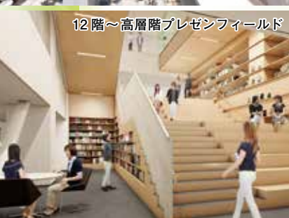
12階～高層階 プレゼンフィールド