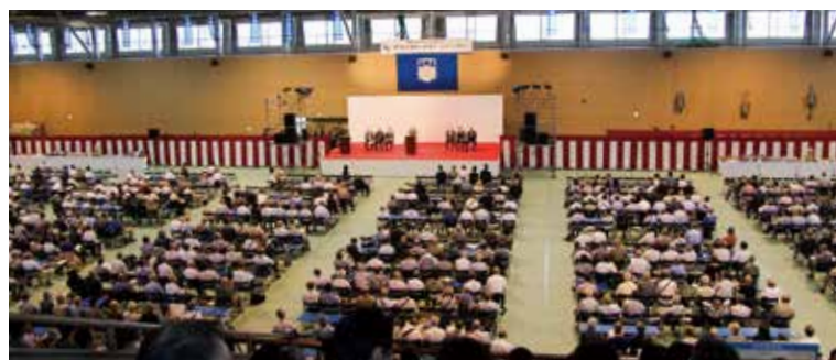
第24回神奈川大学ホームカミングデー式典の様子(横浜キャンパス)