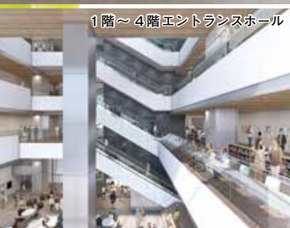
1階～4階 エントランスホール