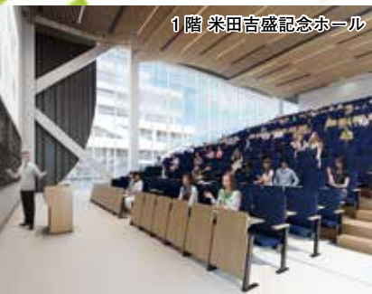
1階 米田吉盛記念ホール

キャンパス計画、横浜・中山両キャンパスを含めたキャンパス新総合計画の推進を図るとする。