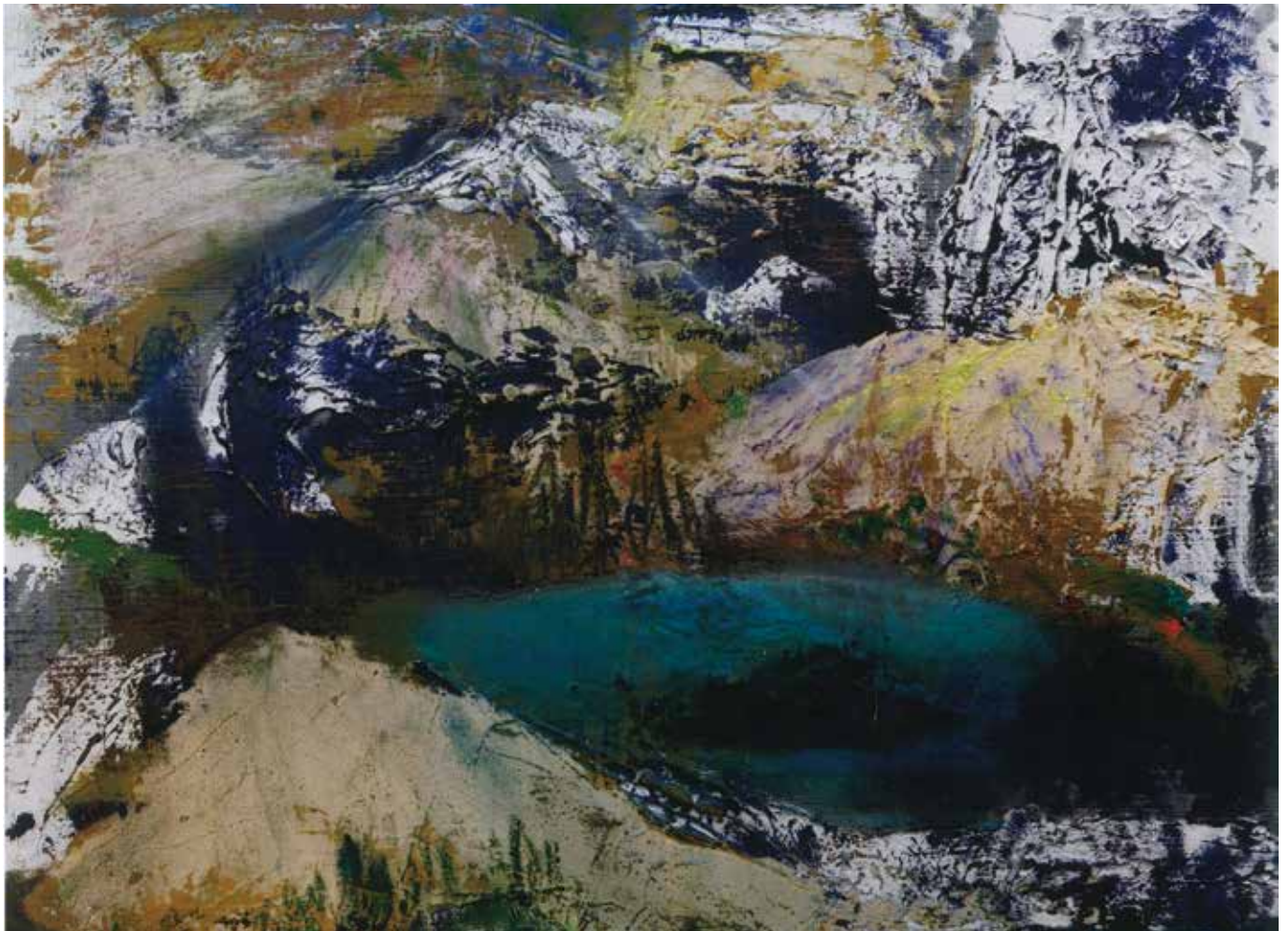
「神楽の里」(絵 渡邊 恵子)

〒221-0802 横浜市神奈川区六角橋3-27-1 神奈川大学内 TEL 045-481-5661 (内線 2451~3) FAX 045-413-0791 kyuryou-jimu@kanagawa-u.ac.jp