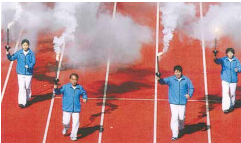
家族3世代で走ったねんりんピック開会式(左から2人目が筆者)