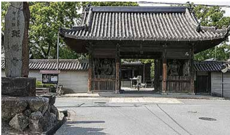
揖保郡太子町にある斑鳩寺

そんななか昨年のこと、元同僚たちから加古川市の「聖徳太子が創建した鶴林寺の見学に行きませんか」と誘いを受けたとき、交差点「鶴」周辺にもゆかりの寺があるのではないかと思ひ浮かび、早速調べたところ、