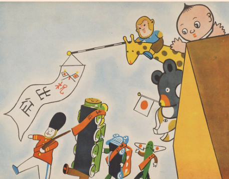
『オモチャの出征』日本教育畫劇,1942.3.5より

『児童文化とは何であったか』つなん出版2004により日本児童文学学会奨励賞 雑誌『教育紙芝居』・『紙芝居』の復刻(金沢文圃閣)により堀尾青史賞 ほか